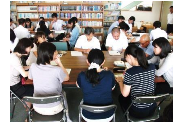
飯沼中、中野小、川辺小 3校合同研修会