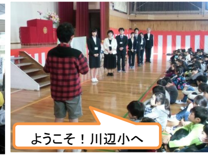
ようこそ！川辺小へ