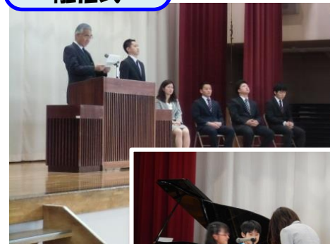
先生、ありがとうございました。