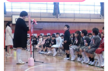
対面式：なんでもきいてね