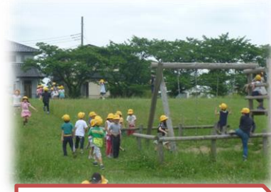
公園探検(1年生)東中野公園