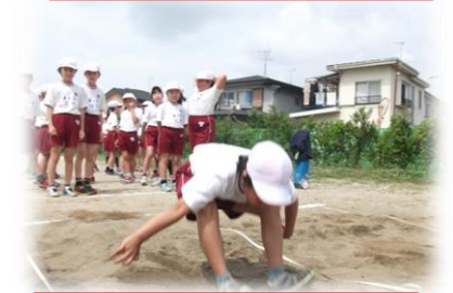
新体カテスト(立ち幅跳び)