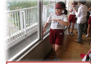
アイマスク体験(4年生)