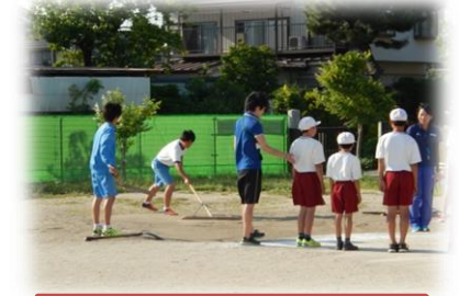
陸上練習(中学生が指導に!!)