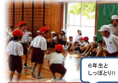
体カづくり(1年生と6年生)