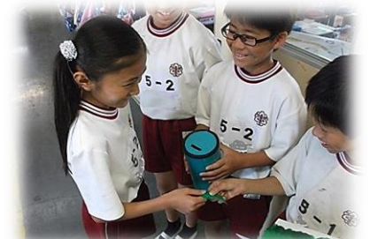
緑の募金(ありがとう!)