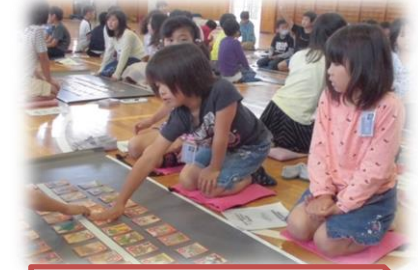
郷土かるた講習会(3年生)