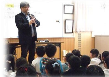
リコーダー講習会(3年生)